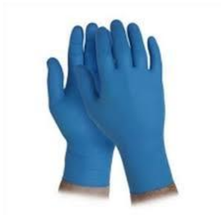
Guanti in nitrile

Inoltre per gli studenti con disabilità certificata il Consiglio di Classe, tenuto conto delle specificità dell'alunno e del PEI, ha la facoltà di esonerare lo studente dall'effettuazione della prova di esame in presenza, stabilendo la modalità in video conferenza come alternativa.